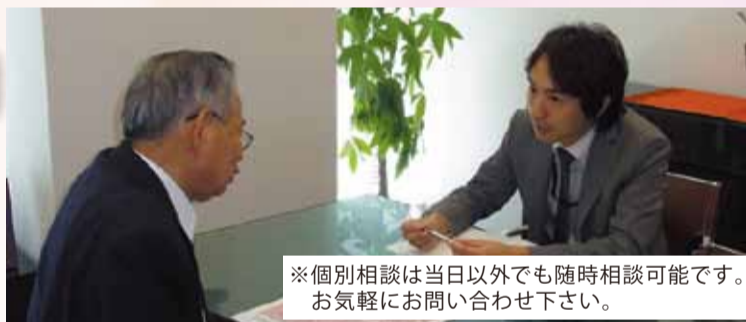
※個別相談は当日以外でも随時相談可能です。お気軽にお問い合わせ下さい。

「地代の相場は?」「借地権は譲渡できるのか?」等、お悩みの「貸家・借地問題」についてわかりやすく、解説いたします。秘密厳守の上、個別に対応いたします。