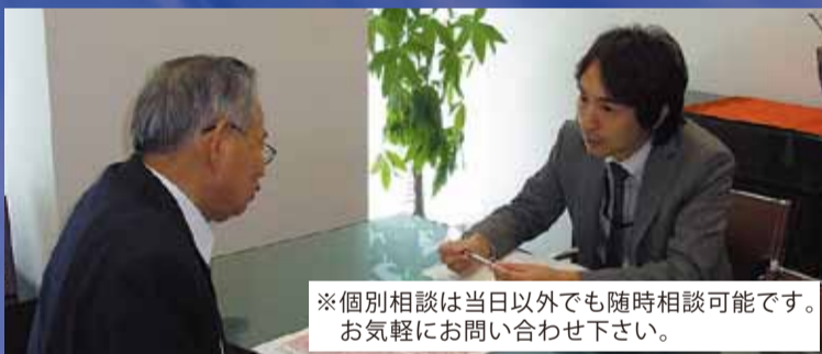
※個別相談は当日以外でも随時相談可能です。お気軽にお問い合わせ下さい。

「地代の相場は?」「借地権は譲渡できるのか?」等、お悩みの「借地・貸家問題」についてわかりやすく、解説いたします。秘密厳守の上、個別に対応いたします。